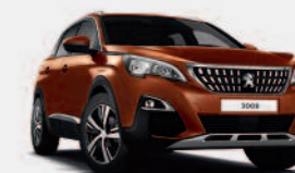
Коричневый Metallic Copper