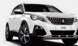
Белый Blanc Banquise