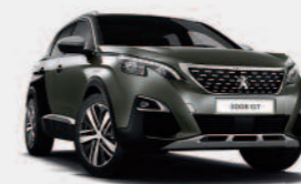
Серый Amazonite Grey / черный Perla Nera