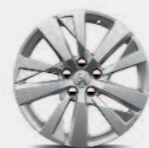
17-дюймовый литой диск CHICAGO

Подчеркните основную идею дизайна. Выберите из двух дизайнов дисков диаметром 17 дюймов или 18 дюймов с алмазным напылением.