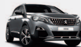
Серый Gris Artense