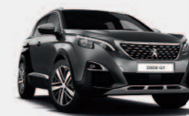
Серый Platinum Grey / черный Perla Nera