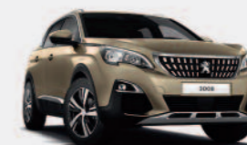
Бежевый Beige Pyrite