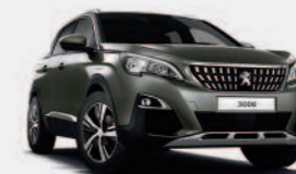
Серый Gris Amazonite