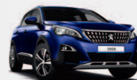
Синий Bleu Magnetic