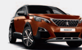
Коричневый Metallic Copper / черный Perla Nera