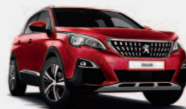
Красный Rouge Ultimate