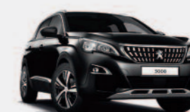
Черный Noir Perla Nera