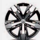
18-дюймовый литой диск LOS ANGELES, двухцветный с алмазным напылением