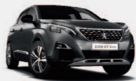
Серый Gris Platinum

Выберите один из одиннадцати цветовых вариантов тот, который будет соответствовать именно вашему темпераменту.