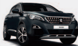
Серый Gris Hurricane