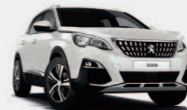
Белый Blanc Nacré