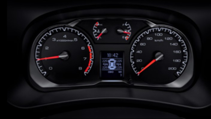
Дисплей бортового компьютера позволяет считывать данные при любом освещении