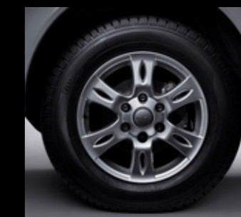
Легкосплавные литые колесные диски, 17"

* Согласно внутренней методике измерения компании.