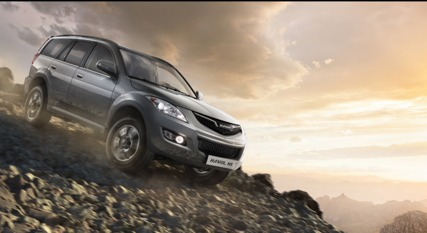
Система помощи при спуске со склона HDC (hill descent control system)

Покоряйте бездорожье благодаря функциям помощи при спуске со склона и при старте на подъеме. Системы помощи контролируют скорость движения и предотвращают скольжение на трудных участках дороги.