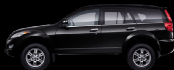
Черный «глубокий космос»