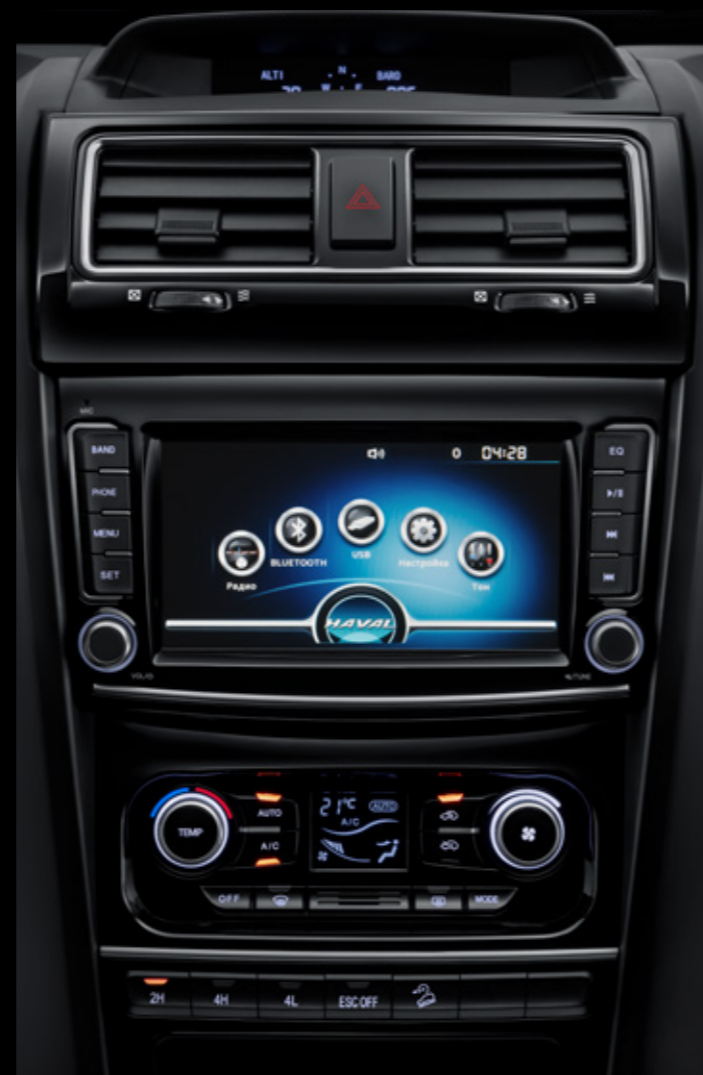
Сенсорный дисплей 8", Bluetooth.