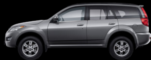
Серый «лунные блики»