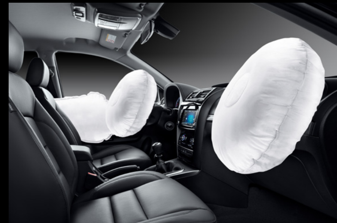
Фронтальные и боковые подушки безопасности