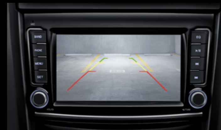
Камера заднего вида с динамической разметкой