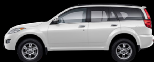
Белый «млечный путь»