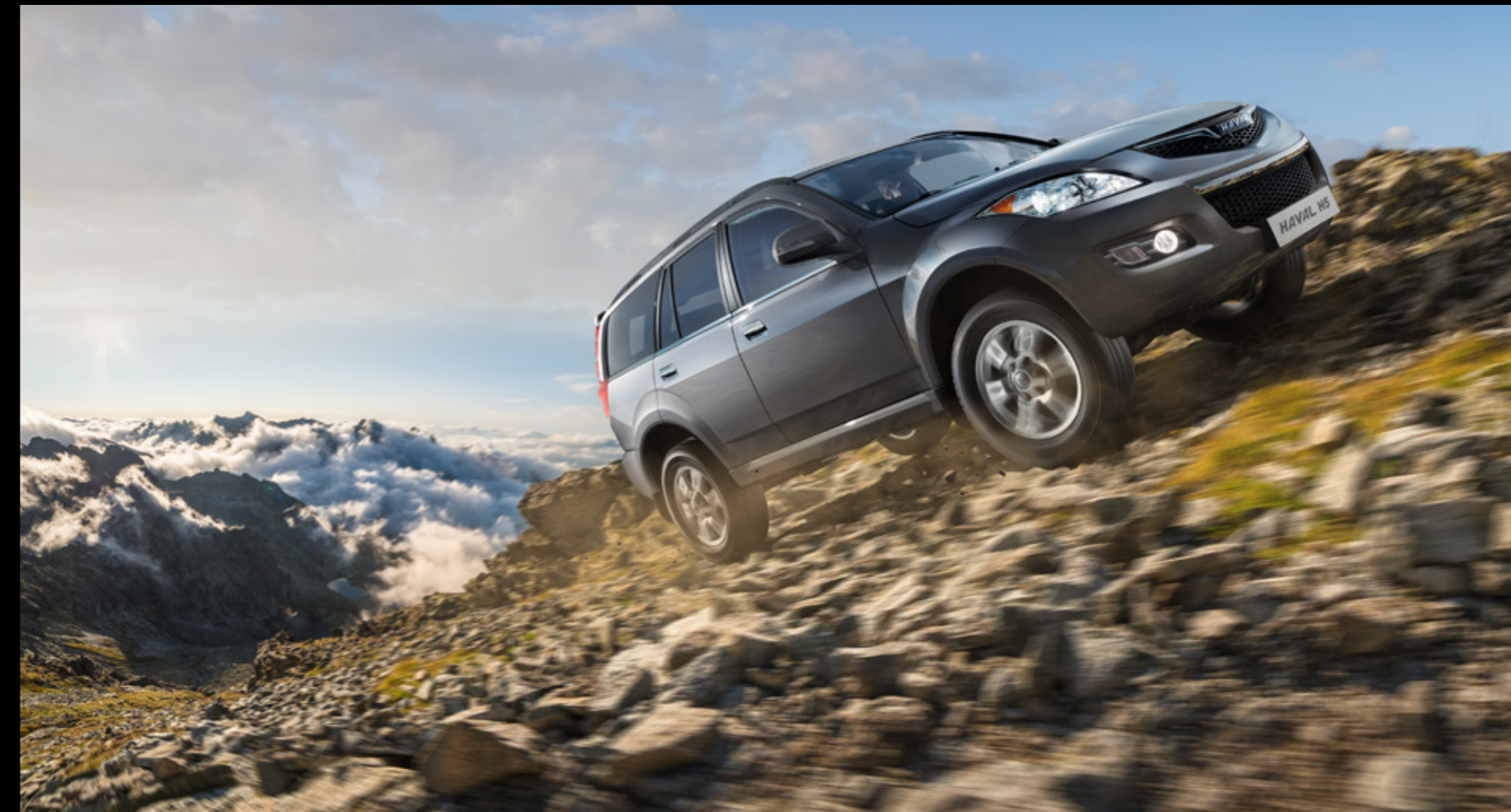
Система помощи при старте на подъеме HHC (hill hold control system)